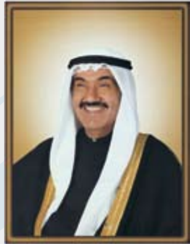
سمو الشيخ ناصر المحمد الأحمد الصباح رئيس مجلس وزراء دولة الكويت