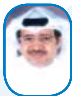
صالح صالح السلمي نائب الرئيس