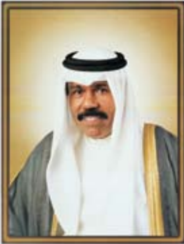
سمو الشيخ نواف الأحمد الجابر الصباح ولي عهد دولة الكويت