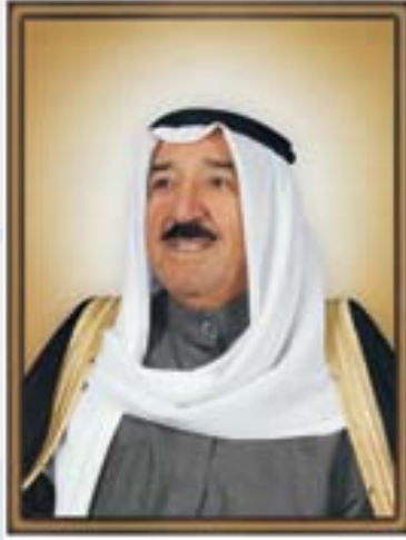
حضرة صاحب السمو الشيخ صباح الأحمد الجابر الصباح أمير دولة الكويت